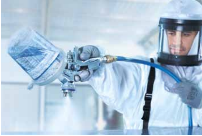
Ohne Adapter – SATA RPS Einwegbecher passen direkt auf die SATAjet 4000 B und reduzieren Gewicht und Reinigungsaufwand.