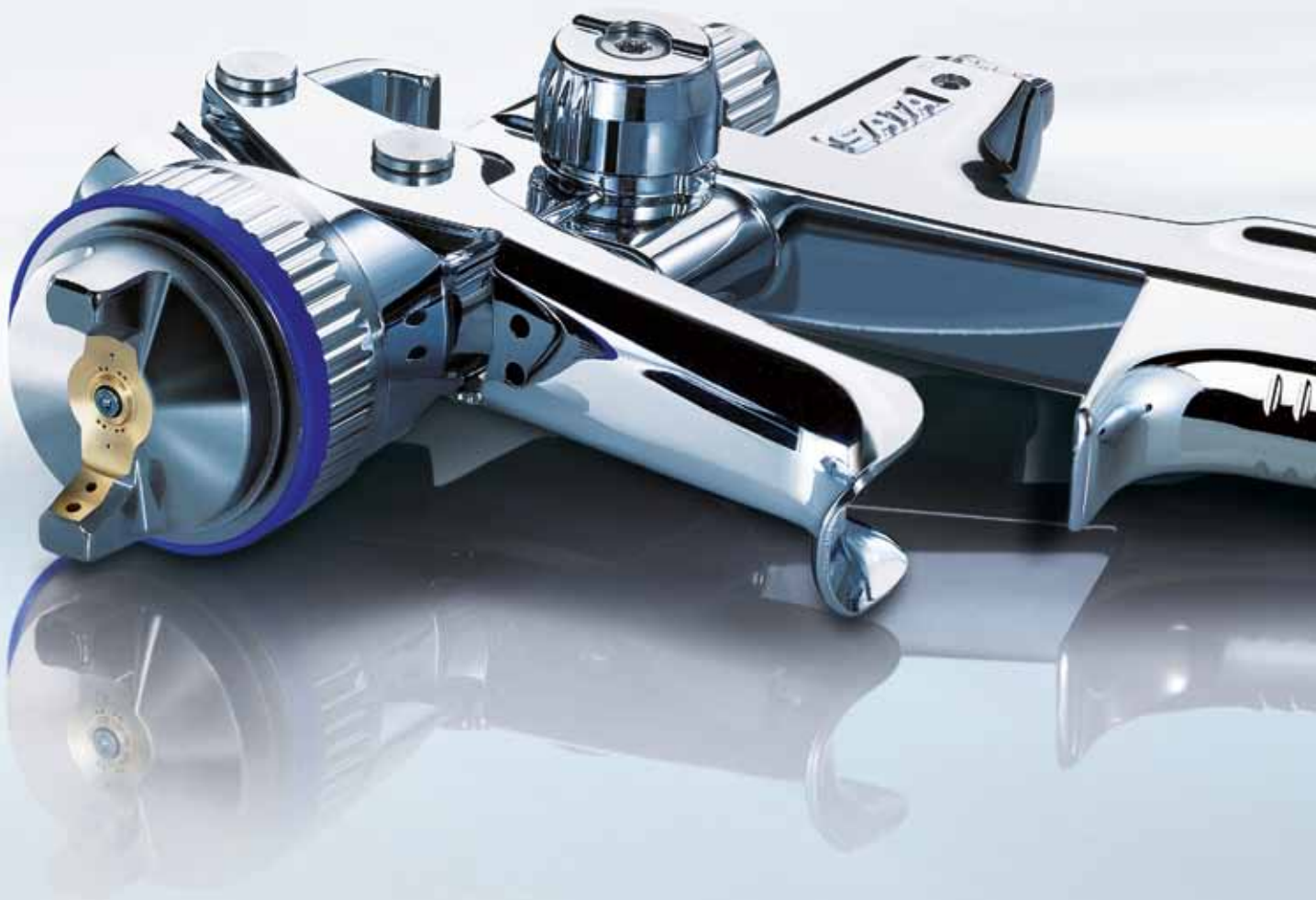
Den Druck im Griff – die DIGITAL® Option: Integrierte Druckmessung und -einstellung – wichtig für die exakte Farb- tongenauigkeit.