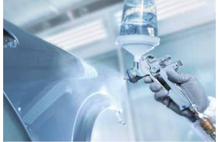
Ein sanfter Spritzstrahl – die SATAjet 4000 B meistert selbst schwierige Konturen in Perfektion.