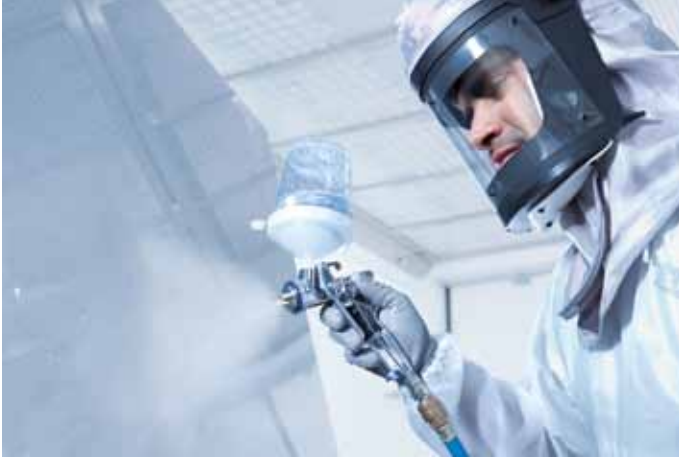
Eine perfekte Passform – die SATAjet 4000 B liegt wie angegossen in der Hand.